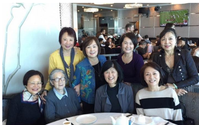
學姊常常探望聖心退休姆姆們