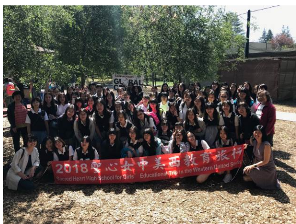
國三學妹參訪 Atherton 聖心