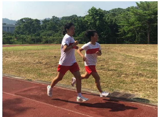
聖心女中體適能檢測