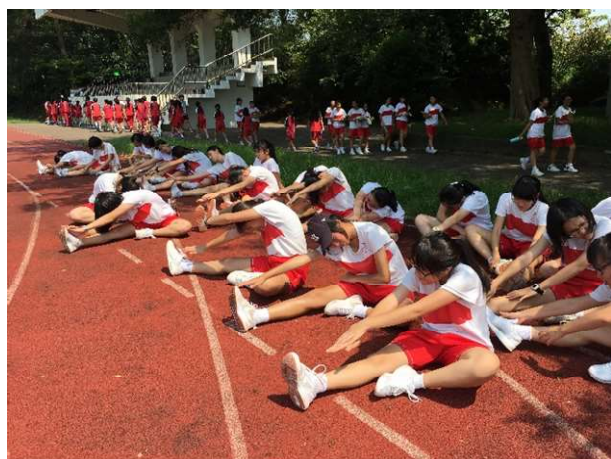
聖心女中體適能檢測