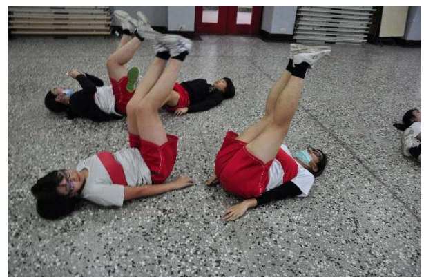
聖心女中體適能檢測-熱身與體能訓練