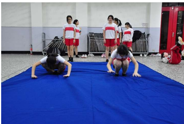
聖心女中體適能檢測-熱身與體能訓練