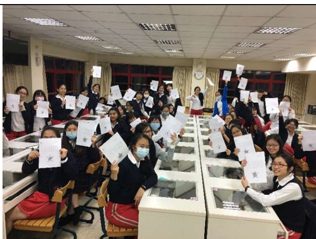
聖心女中體適能檢測-體適能護照