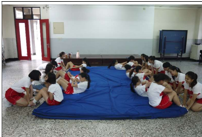
聖心女中體適能檢測