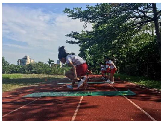
聖心女中體適能檢測