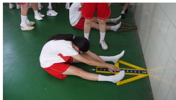
聖心女中體適能檢測