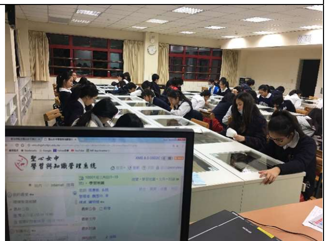
聖心女中體適能檢測-體適能護照