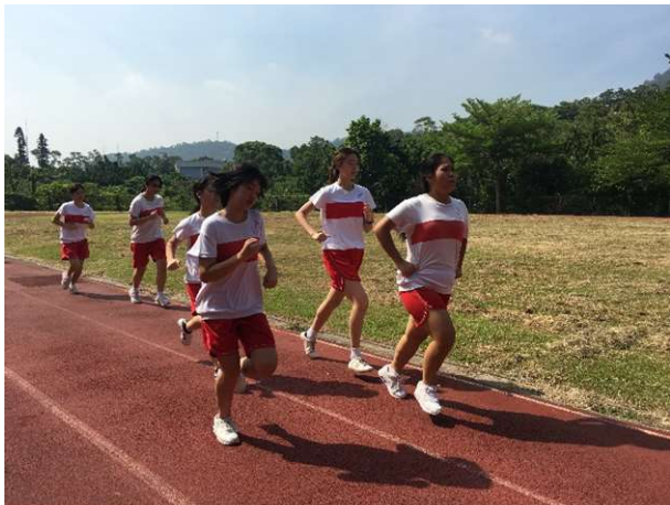
聖心女中體適能檢測