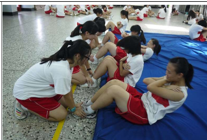
聖心女中體適能檢測