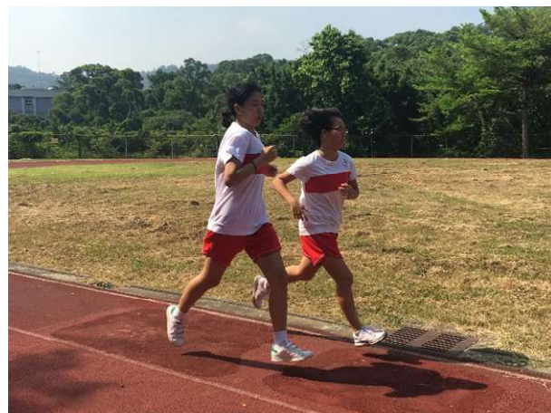
聖心女中體適能檢測