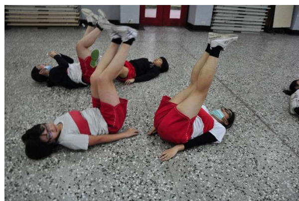
聖心女中體適能檢測-熱身與體能訓練