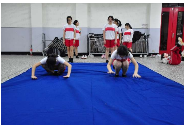
聖心女中體適能檢測-熱身與體能訓練