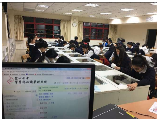
聖心女中體適能檢測-體適能護照