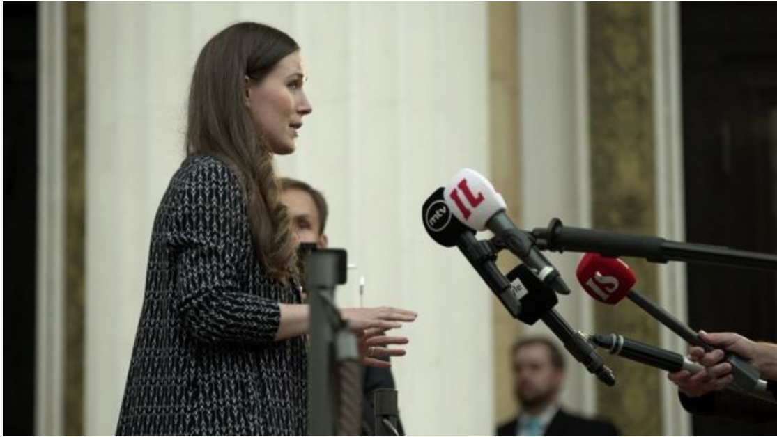
桑娜·馬林總理度完蜜月回去上班第一周在主持「平權計劃」會議前與記者見面

從許多方面看，這樣一個聯合政府的出現屬於萬事俱備，應運而生。如果世界上真有一個國家可以變成《神奇女俠》（Wonder Woman）影片中的神力女超人島那樣的女性主義烏托邦，那就是芬蘭。