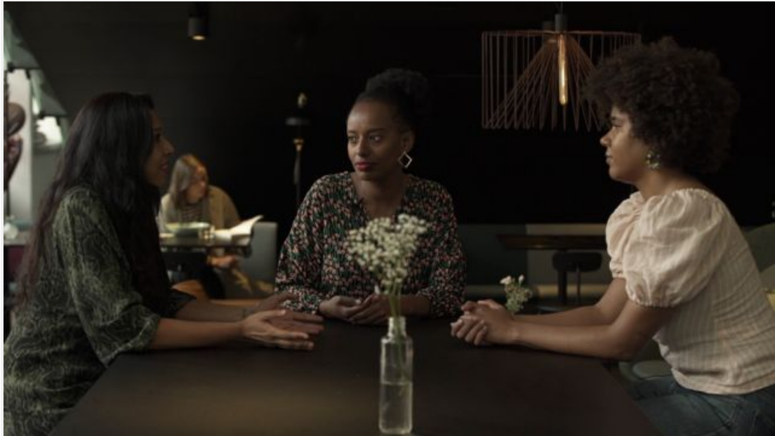
貝拉·佛斯格倫（Bella Forsgren，中）是芬蘭唯一一位黑人國會議員。

2020年4月，馬林政府抗新冠疫情成績出色，民意調查顯示她的支持率達到85%。她自己則表示通常不關注民意調查。