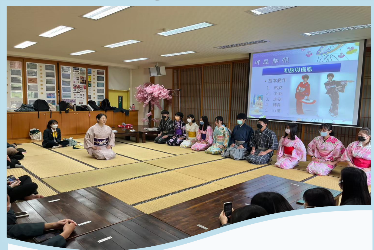
夏日和風物語-感受浴衣體驗 日式文化和服體驗