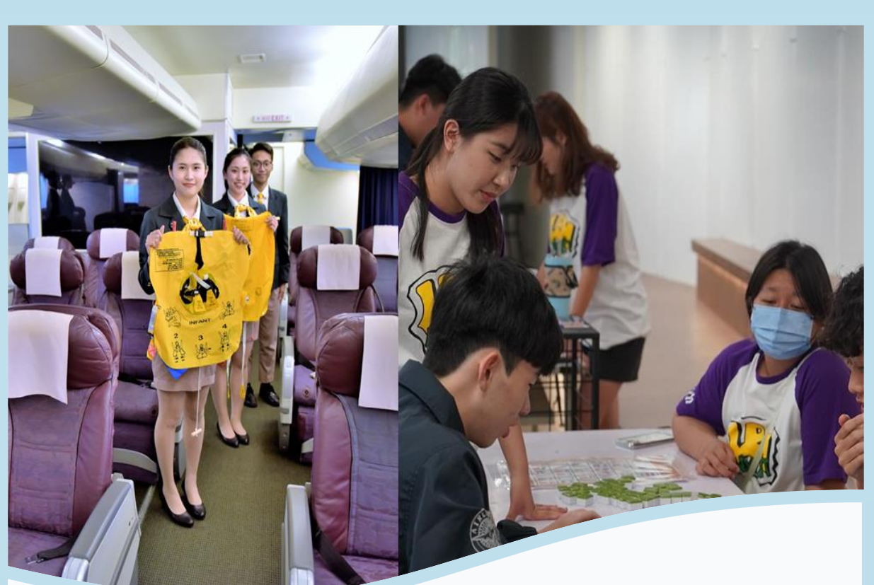
雙線體驗-空服小達人 vs 休閒腦力激盪 航空安全與設備體驗、休閒腦力激盪桌遊