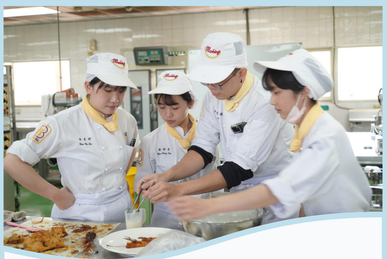
爆漿 vs 爆香對決 手作比薩及芒果大福甜點