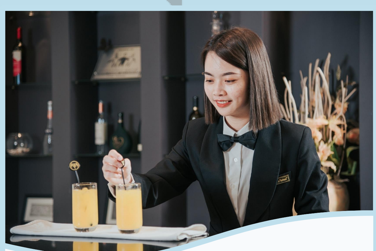
風味起始-餐飲職人初體驗 咖啡或非咖啡因飲調製作