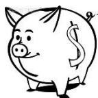
私校退撫儲金(新制)-自主投資 114年度1月~12月期間報酬率

3. 資料來源：財團法人中華民國私立學校教職員退休撫卹離職資遣儲金管理委員會網站公告資料。